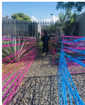
Intervenciones en el espacio público, Universidad de Celaya