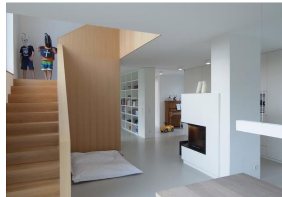
Interior de la Casa M en Laupheim Crédito Foto: Propiedad de A-U-R-A GbR

El trabajo de su despacho aspira a generar, mediante conceptos claros, soluciones de diseño hechas a la medida. Cada proyecto busca, en relación a sus contexto, ser la síntesis entre cultura, calidad espacial y el manejo pragmático y eficiente de la forma, el programa arquitectónico, los costos y los sistemas constructivos y energéticos.