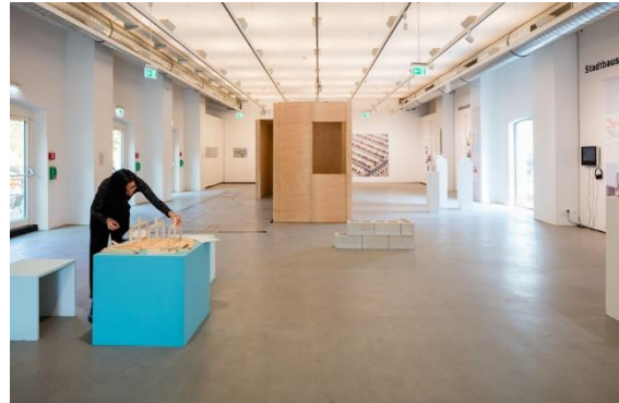
Exposición "Häuser für Alle / Vivienda para Todos" en Stuttgart