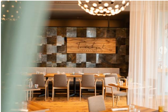
Interior del Restaurant Treibgut en Ulm