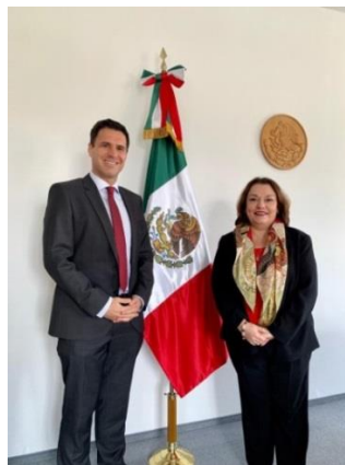
Cónsul Villanueva y el nuevo Cónsul General de Chile.