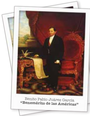
Benito Pablo Juárez García "Benemérito de las Américas"

Benito Juárez vivió una época crucial en la formación del Estado mexicano, considerada por muchos historiadores como la consolidación de la nación como República. Juárez marcó un parteaguas en la historia nacional, y fue sin duda, su temple el que logró rescatar la soberanía nacional frente a las potencias extranjeras, y a los intentos de nuevos imperios mexicanos.