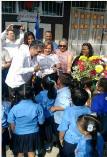
Cónsul de México inaugurando