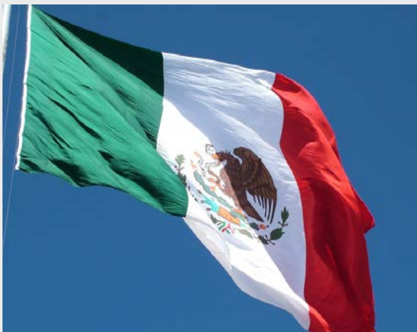
Bandera de México

El 24 de febrero el personal del Consulado de México en San Pedro Sula celebró un año más del aniversario del “Día de la Bandera”, en las instalaciones de esa Representación Consular.