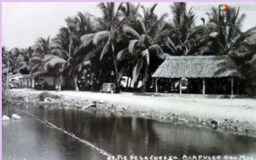
Pie de la Cuesta. Acapulco, Guerrero, 1987