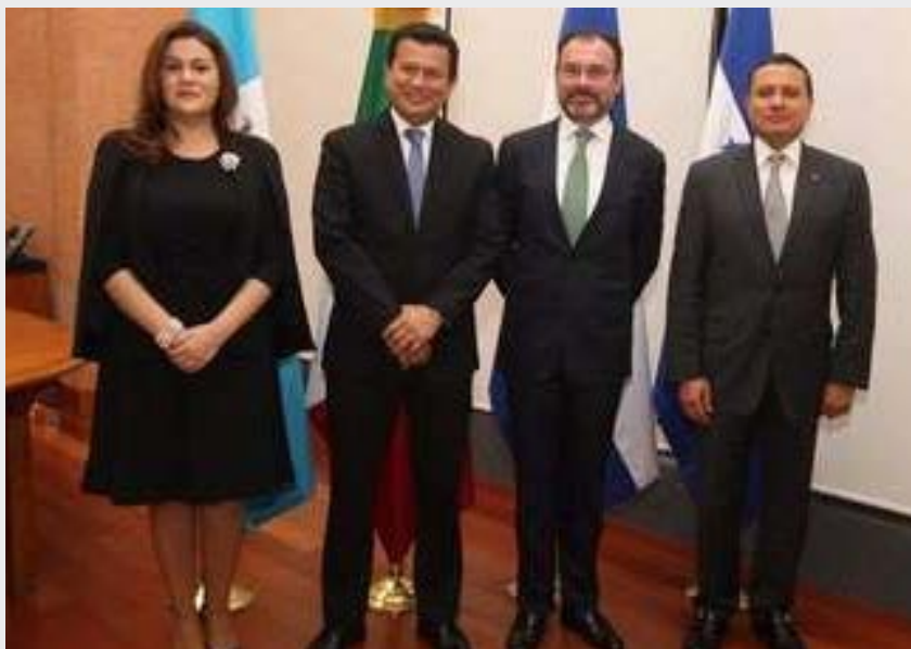
Cancilleres centroamericanos y de México

De esta manera dieron continuidad al diálogo iniciado en noviembre de 2016, en Guatemala, cuando los cuatro países acordaron cooperar en iniciativas que contribuyan a atender las causas estructurales de la migración y el fortalecimiento de las redes consulares.