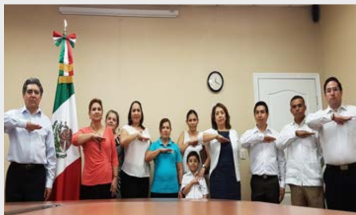
Celebración del Día de la Bandera en el Consulado de México en San Pedro Sula

La actual Bandera de los Estados Unidos Mexicanos fue adoptada el 16 de septiembre de 1968 y confirmada por la ley en 1984.