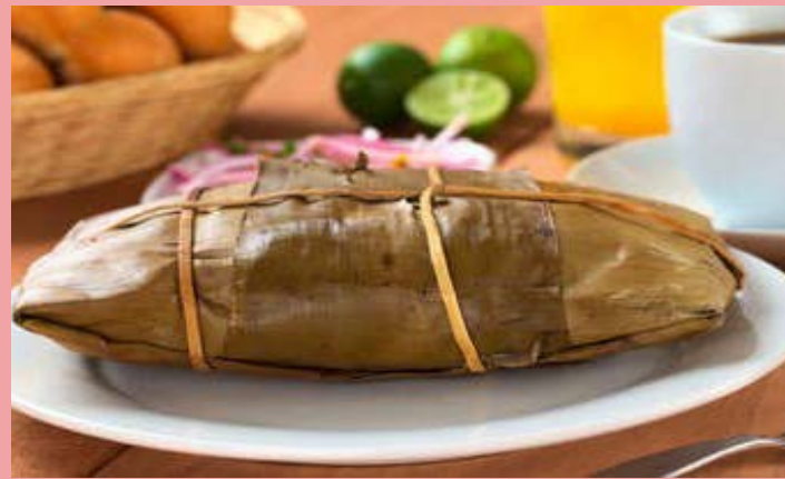
El tamal, platillo de dioses

La tradición está muy arraigada en la sociedad mexicana, ya que los tamales forman parte de la cultura, la historia, la gastronomía y la identidad de los mexicanos, independientemente de la región del país donde se produzca.