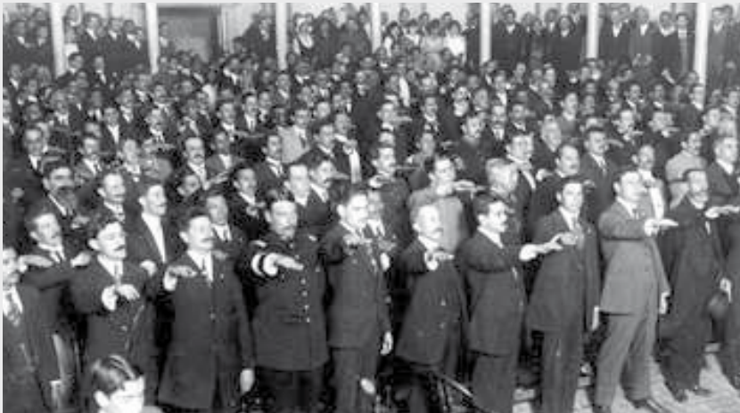
Congreso Constituyente de 1917

La Constitución de 1917 además de considerar buena parte de los ordenamientos de la Constitución de 1857, estableció la forma de Gobierno, que siguió siendo republicana, representativa, democrática y federal; su sistema económico; y las garantías individuales y sociales de los mexicanos.