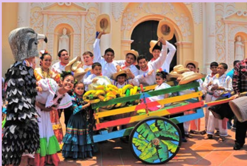
Comayagua, Honduras