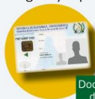
Documento personal de identificación

Original y copia de cualquiera de los siguientes documentos: