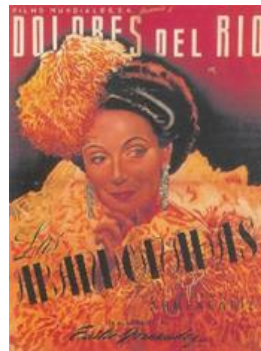
Las Abandonadas Miércoles 13 de agosto 19:00 hrs.