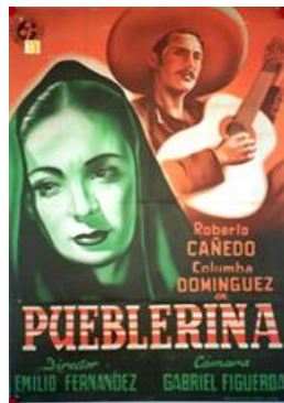
Pueblerina Miércoles 27 de agosto 19:00 hrs.