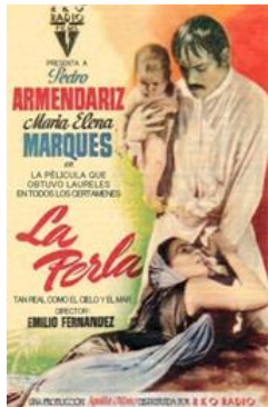
La Perla Miércoles 20 de agosto 19:00 hrs.